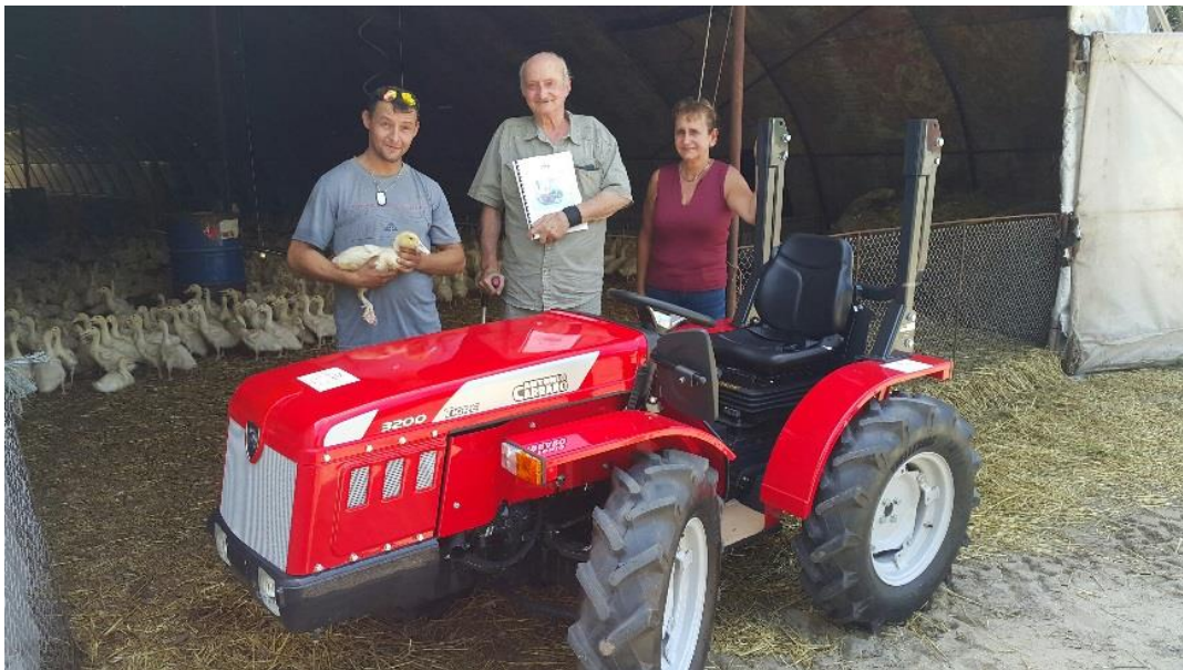
Antonio Carraro Tigre 3200 kompakt traktor

Az Antonio Carraro kompakt traktorok hazánkban mindennapos látványnak számítanak a professzionális szőlő- és gyümölcs ültetvényekben, fóliákban, műfüves és élőfüves sportpályákon, városokban kommunális feladatok ellátása közben egyaránt. Eddig kevés szót ejtettünk az állattartó telepeken való praktikus felhasználhatóságukról. Pedig előnyös tulajdonságaik miatt ebben a szektorban is hatékony és megbízható munkát képesek végezni. Tavaly egy zombói baromfitelepen adtuk át a legkisebb Carraro modellt, több kíváncsi szempár kíséretében, ahová idén is visszalátogattunk. Az élő munkaerő költségének kiváltása, vagy nagymértékű csökkentése jelentősen hozzájárul a kisebb gazdaságok hatékonyságának növekedéséhez. A traktor kiválasztásában döntő érv volt telephelyünk közelsége, mely biztos alkatrész ellátást és szervizelést tesz lehetővé.