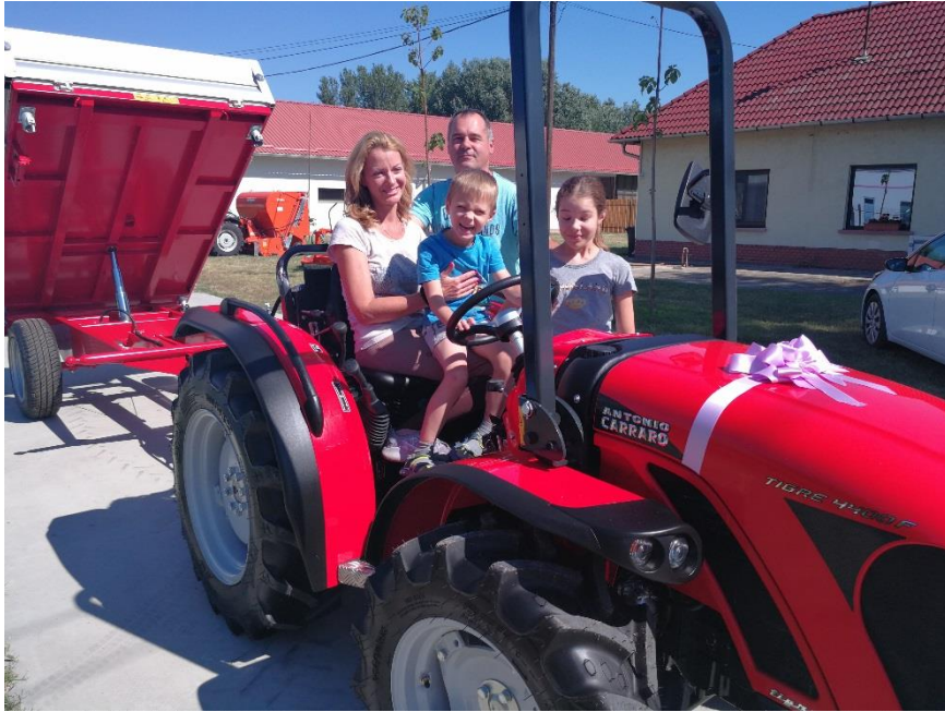
Az átadásra a tulajdonost elkísérte családja is és együtt vehették át a traktor és a pótkocsit.

Idén májusban volt két éve, hogy megnyitottuk zsombói telephelyünket, ahol az értékesítésen kívül helyi márkaszervizünk is működik. Külön szervizautóval és alkatrésraktárral rendelkező modern, barátságos környezetben várjuk a helyi mezőgazdasággal és városfenntartással, sportlétesítmények üzemeltetésével foglalkozó szakemberek megkeresését. A Forrásker-Tész Kft. 2008 óta foglalkozik gyümölcs- és zöldség nagykereskedéssel. A saját raktárral és hűtőházzal rendelkező cég együttműködik a helyi termelőkkel és Forráskútról biztosítja a mindig friss gyümölcsöt és zöldséget a vásárlóinak. A professzionális minőségre való törekvés azonnali közös pont volt a két cég sikeres együttműködésében már a kezdetektől. Telephelyen belüli anyagmozgatáshoz és a zöldterület karbantartásához szükséges erőgépre volt szükségük, mely kompakt, ugyanakkor erős és megbízható. Az Antonio Carraro Tigre 4400 F ültetvénytraktor és a hozzá kapcsolható Ravenna RTE pótkocsi kiváló választás a fenti feladatokra.